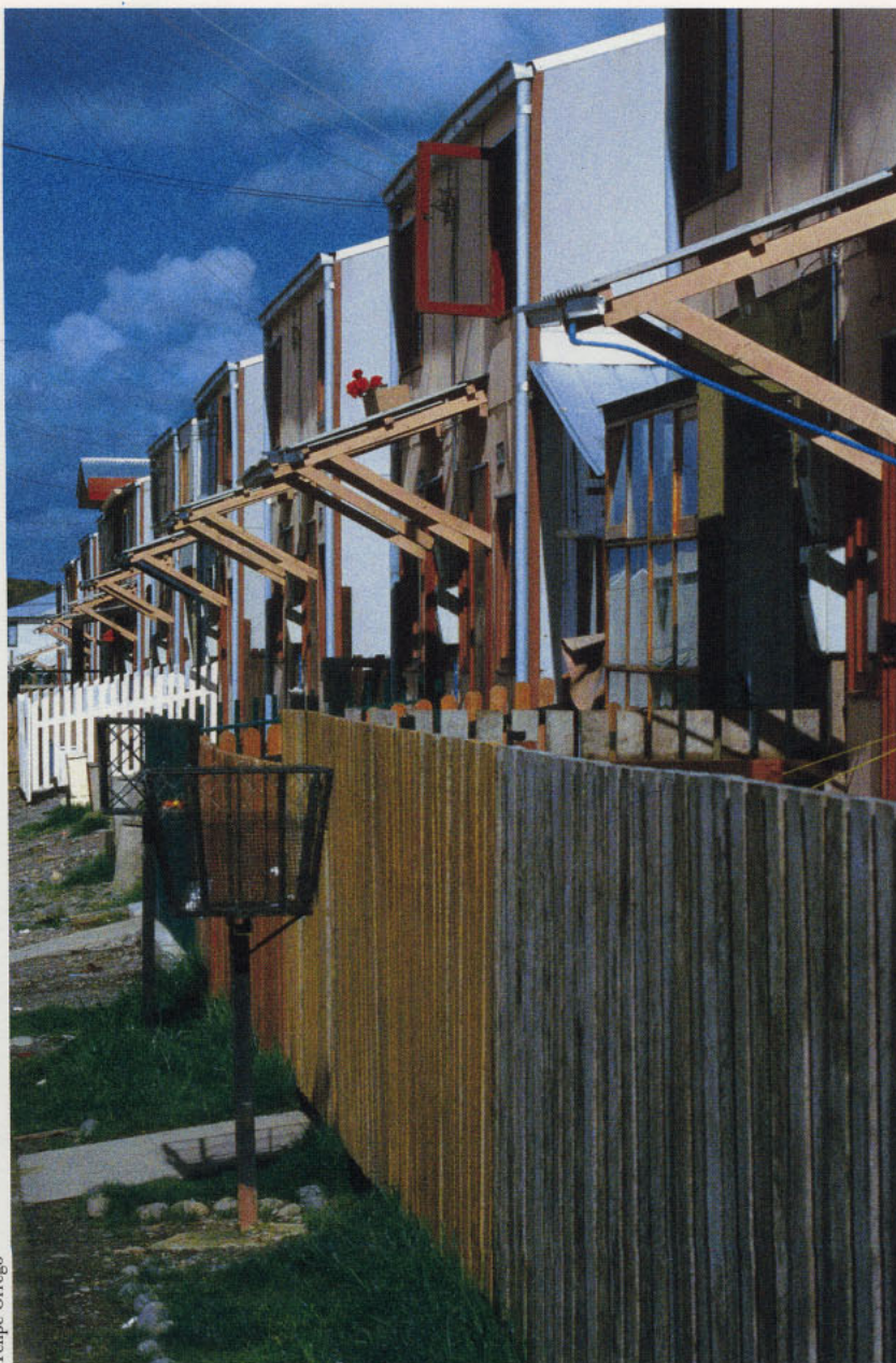
FPC Internacional LLC